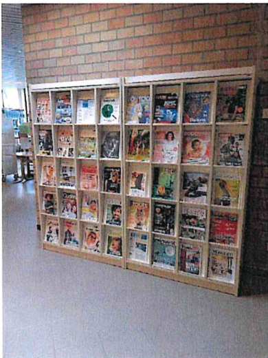
Nieuwe plaats tijdschriftenrek april 2021

Het tijdschriftenrek heeft een nieuwe plaats gekregen in de bib, meer zichtbaar, direct in het oog springend eens men de bib binnen is. Het rek zat wat weggestopt in een hoek achter een muur.